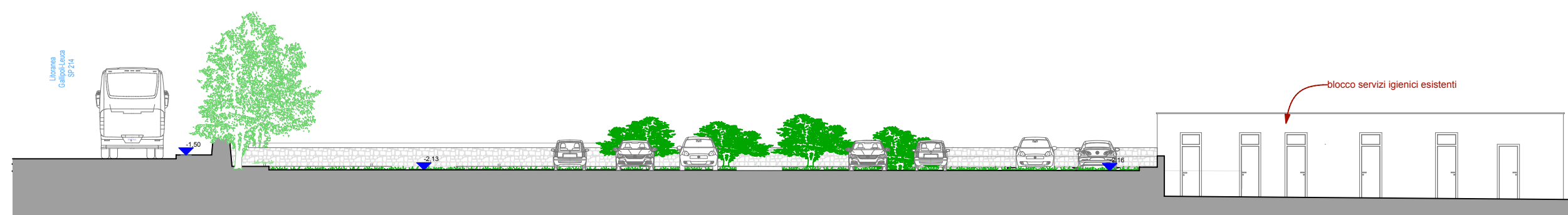
SEZIONE DD scala 1:200