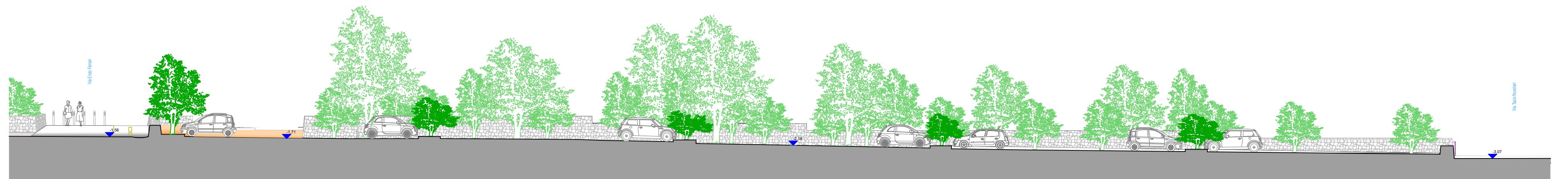
SEZIONE CC scala 1:200