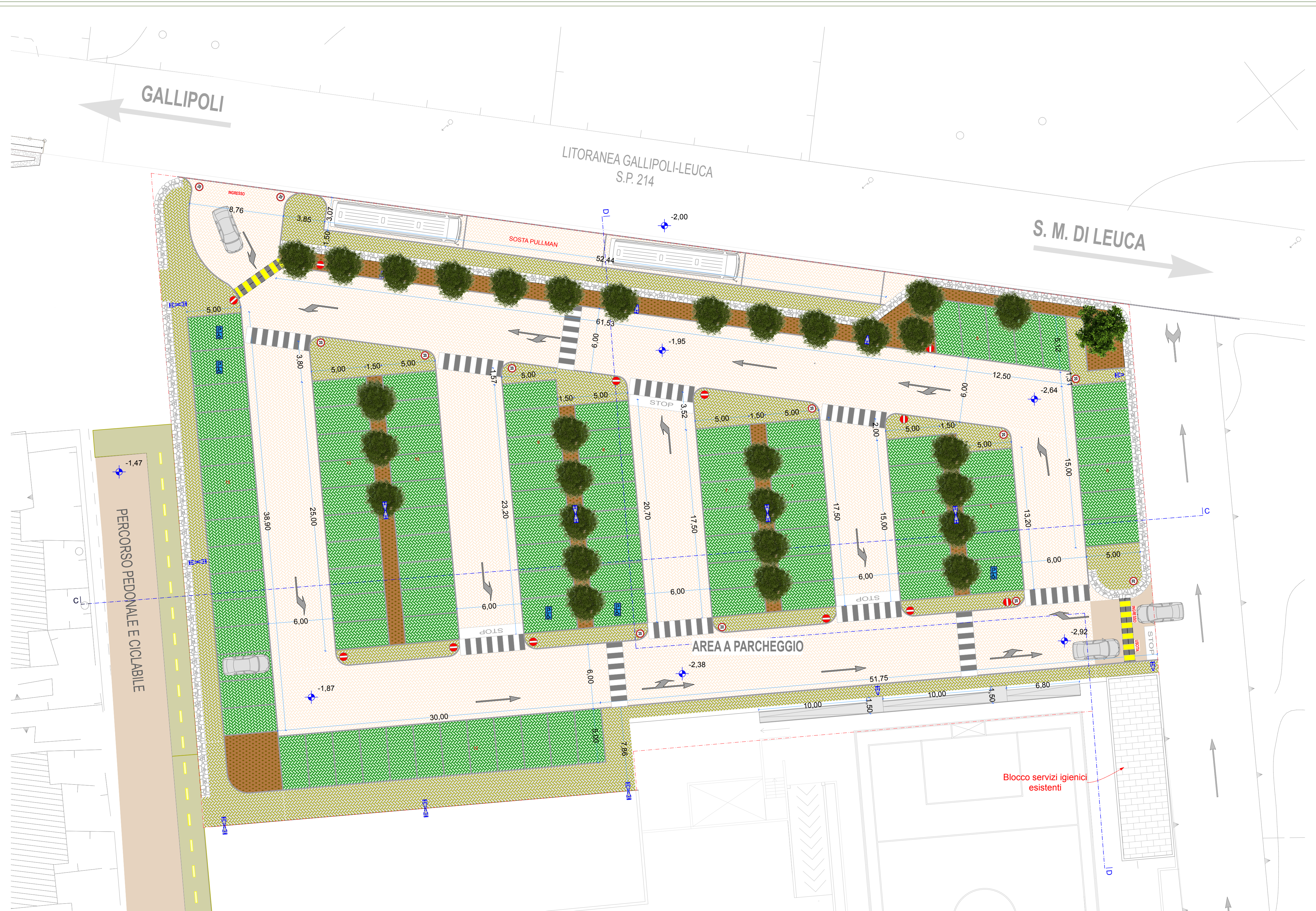
PLANIMETRIA PARCHEGGIO A scala 1:200