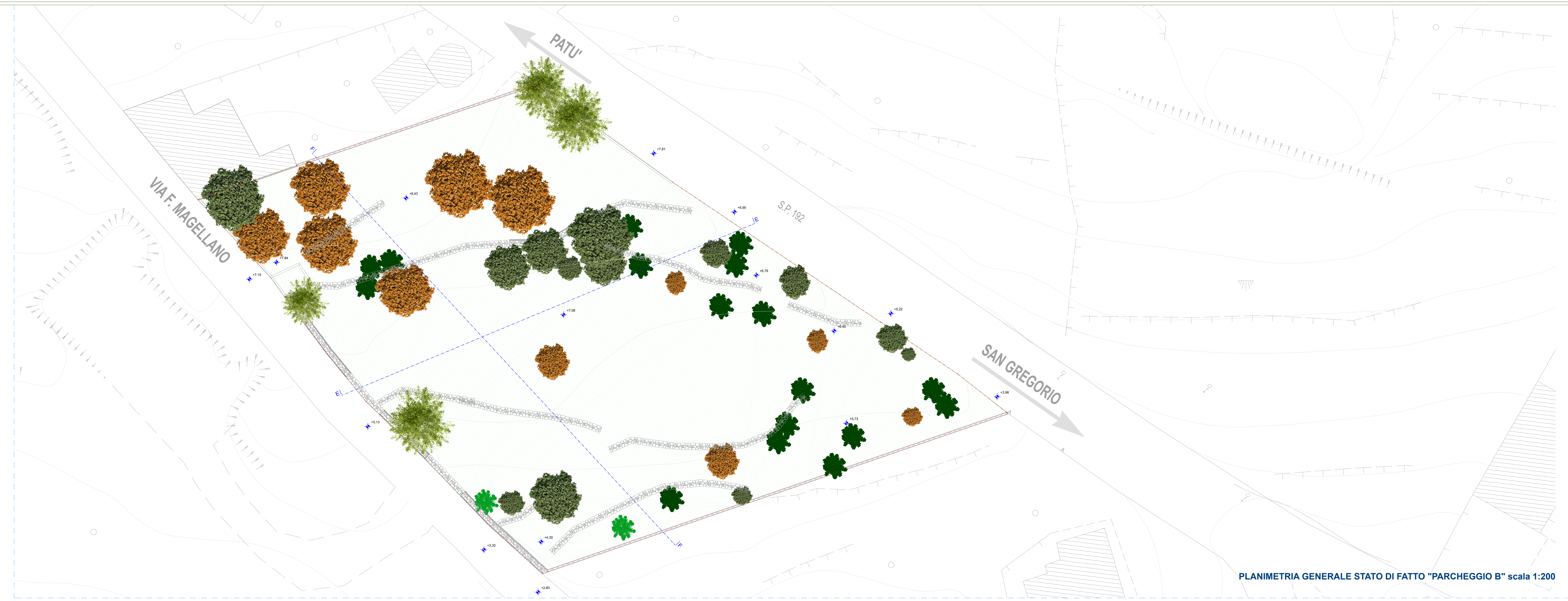
PLANIMETRIA GENERALE STATO DI FATTO "PARCHEGGIO B" scala 1:200