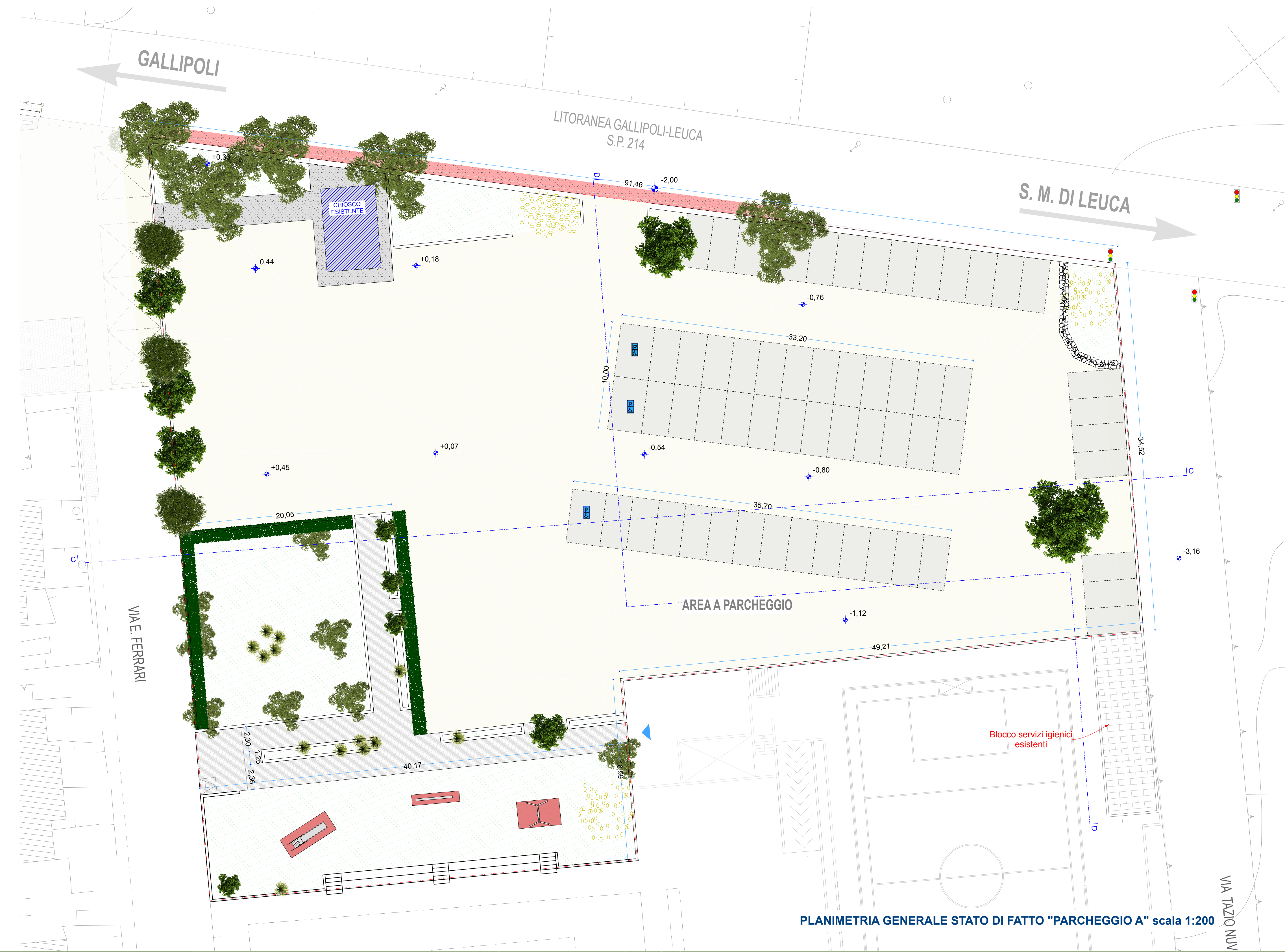
PLANIMETRIA GENERALE STATO DI FATTO "PARCHEGGIO A" scala 1:200