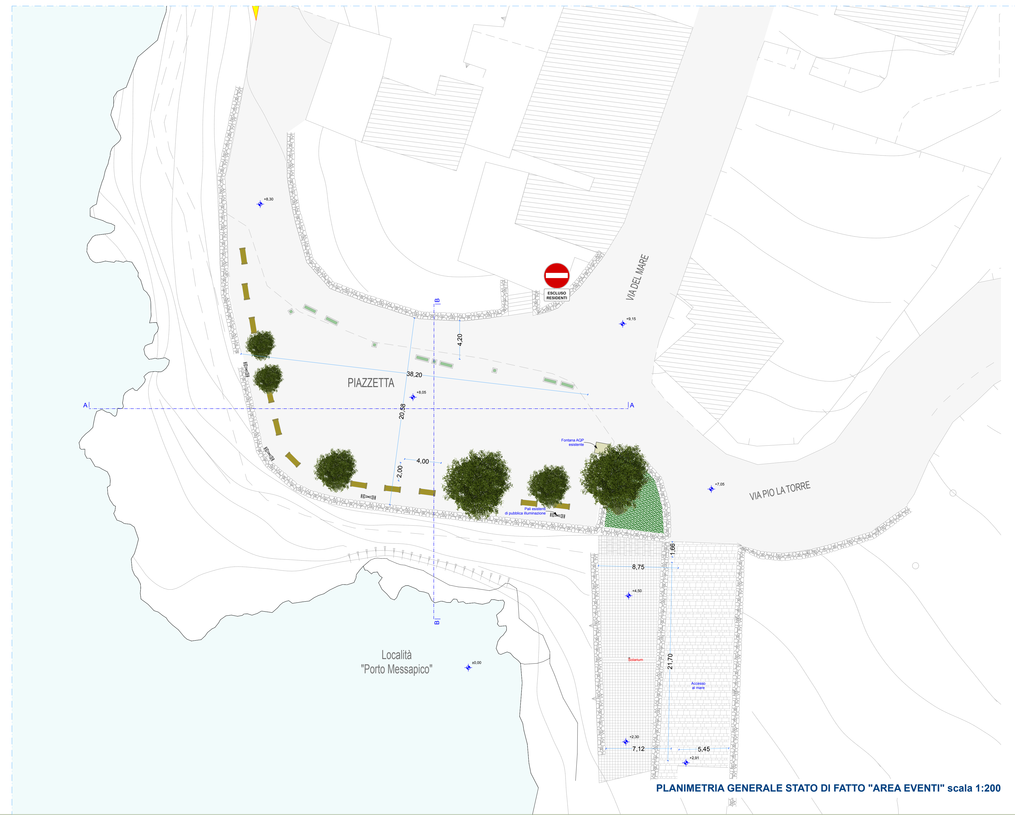
PLANIMETRIA GENERALE STATO DI FATTO "AREA EVENTI" scala 1:200