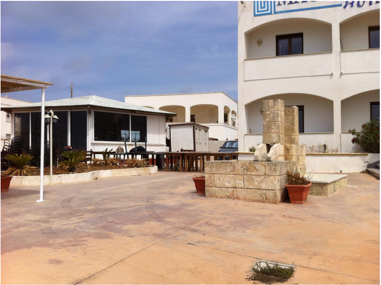
Vista 3 – vista della struttura lignea a carattere precario esistente