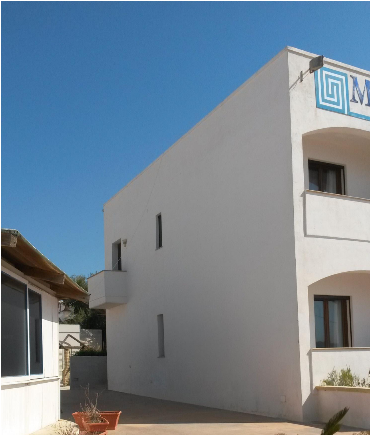
Vista 2 – prospetto ovest, particolare balconi e struttura lignea a carattere precario esistente