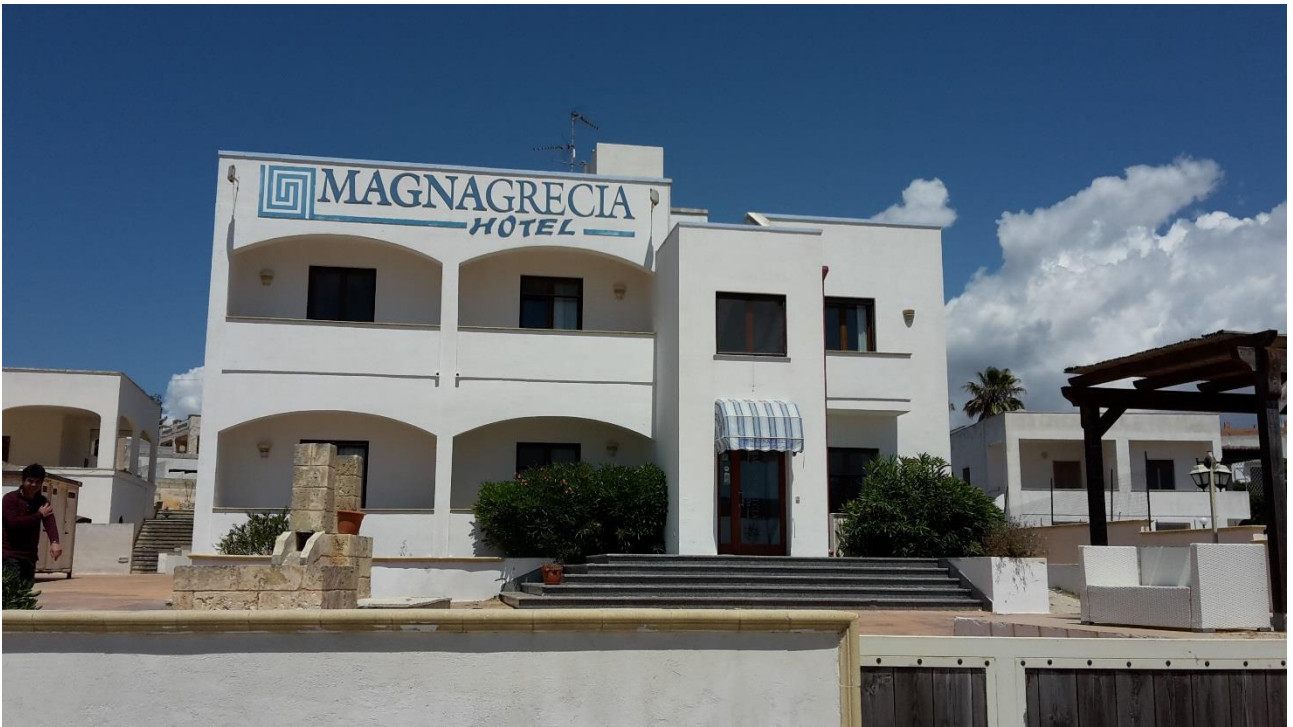
Vista 1 – prospetto sud, ingresso alla struttura turistico-ricettiva